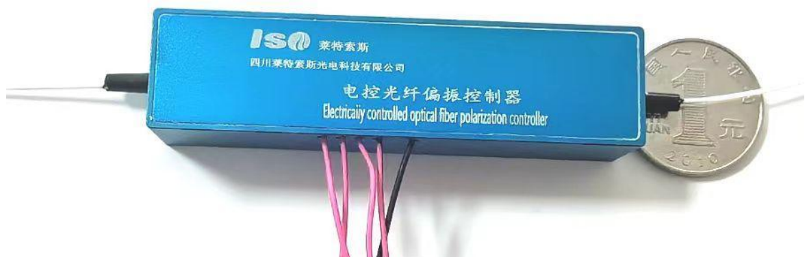
图一、偏振控制器实物图

偏振控制器是指能将任意输入光偏振态转换为任意期望输出偏振态的偏振态控制器件。主要指标包括响应速度、插入损耗、回波损耗、主动损耗、偏振相关损耗和工作带宽等。主要应用于光纤通信和传感领域。在光纤通信中,偏振控制器可以改变输入光的偏振态,在偏振模式色散(PMD)动态补偿、偏振度(DOP)测试和偏振相关损耗(PDL)测试等方面发挥着重要的作用。在光纤传感系统中,偏振控制器主要应用于稳定光的偏振态功能,从而降低外界环境对光偏振态的干扰,提高测试精度。